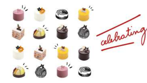
agnès b. CAFÉ 信義店 | 1F

精選韓國進口食材與台本土食材最為完美的結合，呈現經典與現在流行的韓食元素，並以親切、及時、高效率的服務態度打造舒適放鬆的用餐環境。