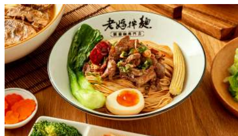
老媽拌麵 信義店 | B2F

以大馬家菜常菜回味老家，瓦煲雞飯蓋子掀開吱吱響，叻沙麵飄著咖哩農鄉，芭蕉葉盛著椰漿飯，在池先生的kopitiam，遇見馬來風味飄香。