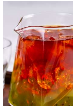
英格莉莉水果茶（奇異果） 推薦價180元

以芬芳沁涼的經典紅茶為底，加入新鮮水果。如同晨霧中的田野，瀰漫著奇異果與青蘋果的清新稚嫩香氣。