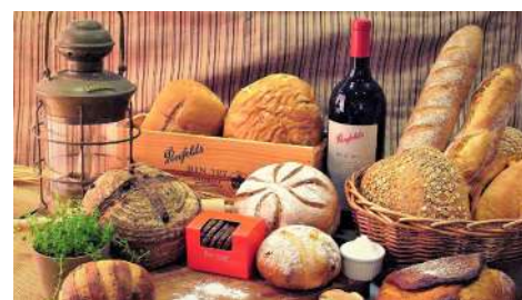
Bonjour 朋廚烘培坊 敦南店 | B1F

創立於民國四十九年，民生西路口賣魯肉飯的攤子。由於味道好、口味佳、真材實料，好口碑帶來了極佳生意。