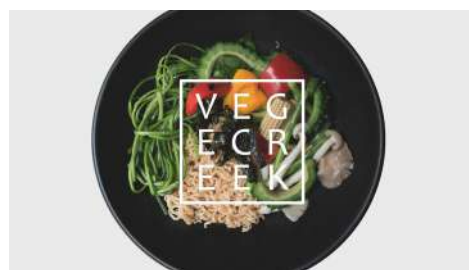
VEGE CREEK 蔬河 南西、敦南店 | B1F / 信義店 | B2F

在米哥，麵包唯一不可缺少的原物料，就是「情感」。米哥不僅在販賣麵包，更是在販賣一種有品味的生活態度及享受美食的幸福感！