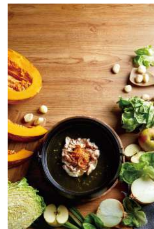
經典石頭鍋 湯底費0元

嚴選各式海鮮，L1等級阿根廷天使紅蝦、大尾草蝦、急凍鮮蝦、生食級鯛魚片、日本生食級干貝，豐盛食材，百元價格，超值享受。