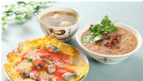
台南蚵仔煎 信義店 | B2F

國人赴香港旅遊，最愛購買的伴手禮「曲奇四重奏」，2018年正式引進台灣。現在無需飄洋過海，即刻就可以輕鬆的在台灣擁有。