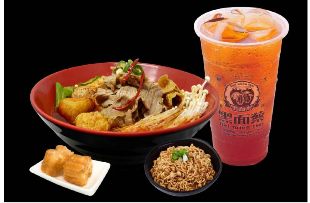
黑面蔡 | 松菸店songyan store B2F

橫跨四、五、六年級生美好回憶，經典黑面蔡楊桃汁，將原本酸澀、難以入口的酸楊桃，在用心採收、挑選、清洗及用數十種天然植物提煉的配方經四個月醃漬發酵後，獨具風味呼之欲出。黑面蔡更結合了茶飲，採用在地好食材與嚴苛標準來打造。溫暖人心的濃情臺灣味，「用料實在、童叟無欺」，就是黑面蔡想讓顧客想起的共同記憶。