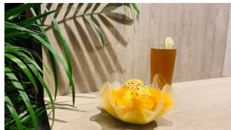
豆夫人紅豆湯 松菸店 | B2F

以年輕、休閒、生活化的「新茶文化」為概念，以天然、健康、人情味的經營理念，堅持以天仁最優質的茶葉，自創出獨樹一幟的外帶茶飲。