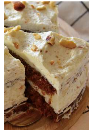
卡蘿凱特 推薦價160元