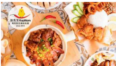
池先生 Kopitiam 信義店 | B2F

幸修園始於東京的一間茶屋。經過長久經驗技術的累積，採用獨特的製茶法製作出美味的日本茶。將嚴格精選的日本商品提供給世界各地的消費者。