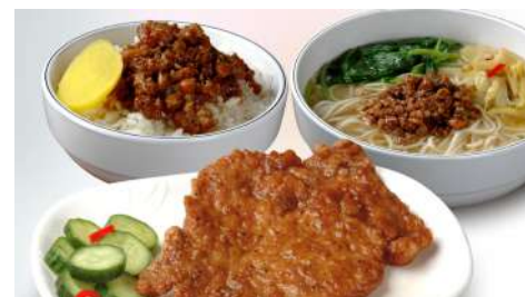
名廚排骨 南西店 | B1F

創立於民國85年，因販售之豆花遵循古法製作，故取名『小南門傳統豆花』。多以專櫃型態經營，因口味傳統道地，深獲好評。