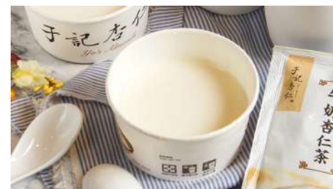
于記杏仁 敦南店 | B1F

每杯飲品的珍珠都是店內夥伴手工製作，打破珍珠奶茶由工廠大批出貨的模式。除了世界首創現場製作珍珠外，也是首個將寶可夢製作成珍珠的品牌。