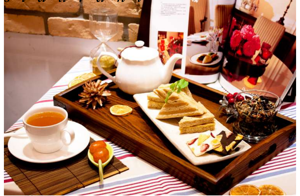
玉波堂 | 信義店 xinyi store B2F

有鑑於近來歐美蔬食風潮與國內素食人口的大幅成長，為了提供重視食安的蔬食與素食消費者更豐富的選擇，伽哩咖哩推出兼顧健康及美味需求的咖哩蔬食系列料理，具有特色的茶飲與咖啡、方便個人獨享以及和好友共享的美味蔬食新天地。