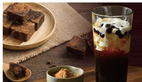
米塔黑糖 南西店 | B1F

秉持質樸、天然、養生的信念製作甜品，用甜蜜滋味溫暖懶懶的午後時光；享受美味甜品時，像是在炎熱夏日躲進大樹下吹著徐徐微風嘴裡甜甜心中也甜甜的。