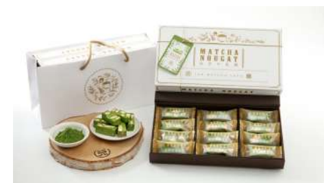
一〇八抹茶茶廊 信義店 | B2F

以20餘年英國茶文化經驗結合了東方茶文化，從西方品味走向東方境界每一個細節都是專業的沖泡，期許一起推動台灣人的生活美學與新時代的茶文化。