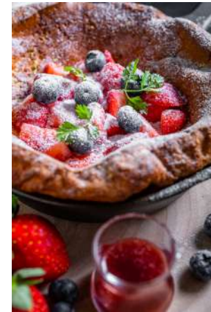
鐵鍋鬆餅（綜合莓果） 推薦價240元

選用日本進口鑽石粉與保濕度極佳的上白糖煎烤而成的厚鬆餅披覆華麗的豹紋衣裳更顯出時尚的元素。