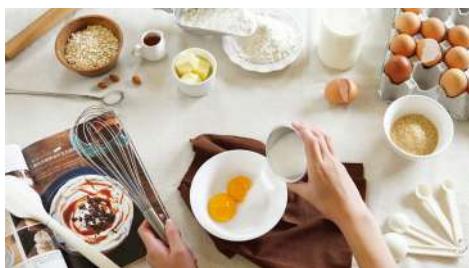
DOUGH動手玩 烘焙DIY 松菸店 | 3F

『堅持手感，傳遞溫暖』米塔集團30年餐飲經驗傳承，以「堅持原味」為製作的準則，「安心、安全」為生產的宗旨。