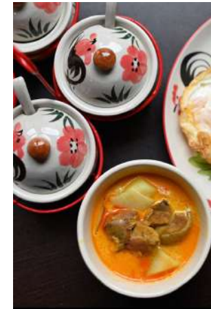
泰式傳統黃咖哩 推薦價250元

新鮮綠辣椒為基底，加入泰國檸檬葉、椰漿、茄子等空運來台的香料與食材調製而成。在you & mee絕對可以吃到最道地的泰國口味。