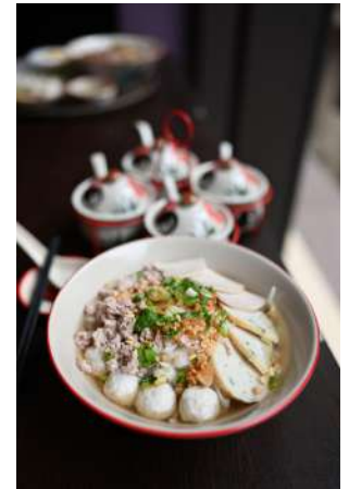
泰式魚丸麵 推薦價240元

獨特泰式辛香料，辣椒、南薑、香茅、紅蔥頭、蒜頭、洋蔥、蝦膏...等在研鉢與研杵的交互樂奏之下，傾出辛香十足的溫順口感。