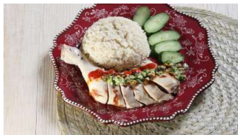
老巴剎 南西店 | B1F

有著台灣四十六年來在在地文化及台灣特有的人情味，針對食材挑選、品質把關的堅持以及對於安心料理的使命感，發展成為全台知名小吃品牌，飄香國際。