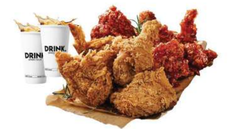
Sweet Josun 南西店 | 1F

秉持純手工製作風格、不為機器替代，真材實料、食材原味，商品皆為專業師傅每日手工製作，採用老麵發酵口感Q彈外皮，提供安心好食的美味手工包子。