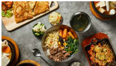
金州韓式料理 敦南店 | B1F

印度支那強調實的是道地越南菜，越南料理不似泰國菜、緬甸菜等那般的酸辣及重口味，卻在清淡中帶著酸甜味，就像是初戀的心情。