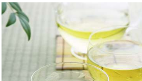
幸修園 信義店 | B2F

用天然食材熬煮高湯製作而成的丼飯專賣店，並採用有機蛋為丼飯加分，讓您吃的美味、吃的健康，為生活加分，美味天堂 - 新井 就是心動！