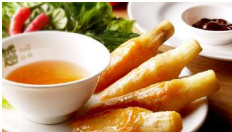
印度支那 敦南店 | B1F

『綠蓋茶·館』創立於2003年，創作飲品『綠蓋茶』以香濃奶酪搭配著茉莉花綠茶，廣受好評！