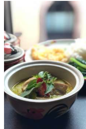
泰式傳統綠咖哩 推薦價250元

新鮮綠辣椒為基底，加入泰國檸檬葉、椰漿、茄子等空運來台的香料與食材調製而成。在you & mee絕對可以吃到最道地的泰國口味。