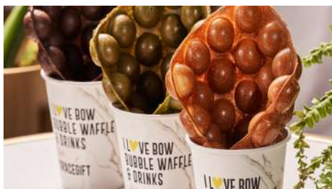
我愛豹豹 南西店 | 1F

台灣自創外帶港點品牌，首創外帶港點。在東區及信義區貨櫃市集火熱營業，選用優質材料，強調分店時尚乾淨明亮形象，扭轉陳舊飲茶油膩茶餐廳印象。