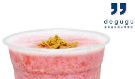
果果迪水果特調茶飲 信義店 | B2F

經營20餘載，始終堅持「尊重自然，崇尚原味」初衷，嚴選天然優質食材，專注工藝。提供新鮮的麵包、西點、節慶生日蛋糕、中西式伴手禮。