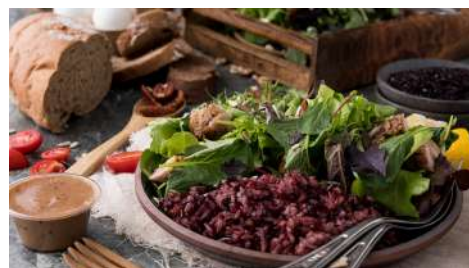
沙拉野餐 松菸店 | B2F

山山來茶的育茶師堅持使用自然農法，以自然的雲霧、雨水與露水補充水分，把茶園交給大自然管理，以敬天的態度手工製茶，真實呈現無添加的自然茶品。