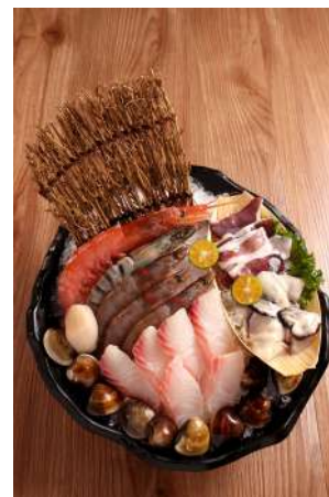
澎派海鮮總匯（單點） 推薦價298元

嚴選各式海鮮，L1等級阿根廷天使紅蝦、大尾草蝦、急凍鮮蝦、生食級鯛魚片、日本生食級干貝，豐盛食材，百元價格，超值享受。