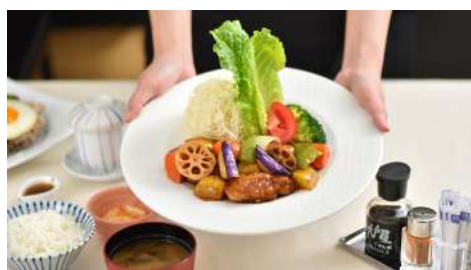
大戶屋 南西店 | B1F

每日均採用最新鮮的黑毛溫體豬肉製作。當香Q米飯遇上濃郁滷肉醬汁，加上香酥軟嫩的排骨，搭配媽媽味道小菜，釀出既熟悉又回味的台灣美味！