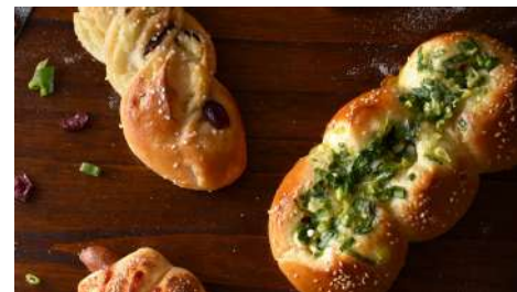
米塔手感烘焙 松菸店 | B2F

招牌綿密紅豆湯、水果雪花冰為了呈現最原味口感，親自挑選所有食材，從萬丹紅豆、大甲芋頭、濁水溪黑米到台南清蒸肉圓，每樣都吃得到老闆的用心。