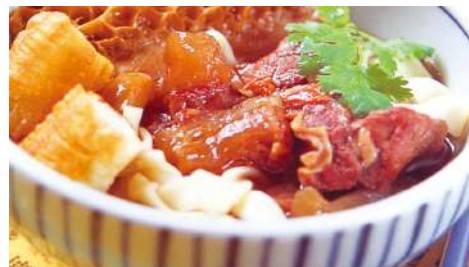
論之園 信義店 | B2F

有一種甜味，須經過慢火熬煮，所以用古法烹煮內餡有一種香味，須時間低溫蘊釀，嚴選自然熟成的冬麥有一種生命，須用心延續，老麵成為麵包風味的啟動者。