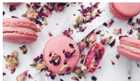
HABIBI 信義店 | B2F

希望消費者來到這裡，能從忙碌生活中獲得短暫屬於自己的空間及時光，放下煩躁、飲一杯特製的水果茶飲，一起擁有城市裡截然不同的茶飲體驗！