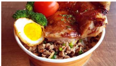
泰飽 信義店 | B2F

<THAI.BO!泰飽-泰式飯包>想呈現給大家美味、道地、不添加任何味精的健康泰式飯包。精選多款美味泰式主菜，期待帶給大家不同的味蕾感受。