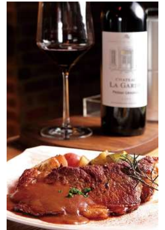
美國頂級10z肋眼牛排 佐黑松露奶油醬

多種香料加洋蔥、紅蘿蔔、西洋芹菜和啤酒醃漬整天的去骨雞腿，吸收飽滿汁液先煎後烤，咬下去每一口都讓客信體會到用心。