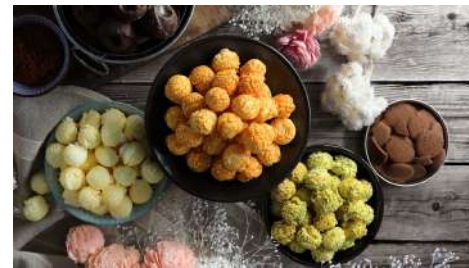
MagiPlanet 星球工坊爆米花 信義店 | B2F

精選食材，獨家創新的烹調手法，創造出獨特的「駱姐正雞酒」，調氣補血，四季皆宜，日常進補，適合全家享用，令人再三回味！