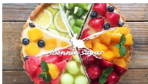
Bonnie Sugar 信義店 | B2F

源自花蓮，無毒自耕米食原料及天然艾草，專營各式手工米食產品與客家美食，每日新鮮現做絕不添加防腐劑。