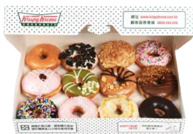
Krispy kreme 南西店 | B1F

天仁茗茶第二個茶飲品牌。結合東西方飲茶文化與技術，嚴選世界各地好茶，搭配天仁茗茶製茶技術、鮮萃每一杯好茶，淬煉出品牌茶飲獨有特色。