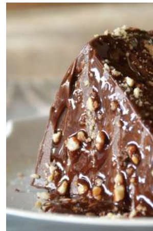
深黑巧克力蛋糕 推薦價160元