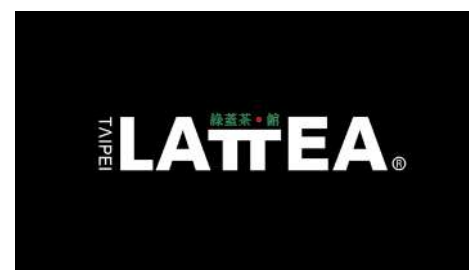
綠蓋茶·館 信義店 | B1F

無論選材、攪拌、整形、麵團發酵、烘焙，每階段的製作過程，就是為了提供最好的品質與口感，而每個步驟的細心製作，帶來國際化的視野與口感。