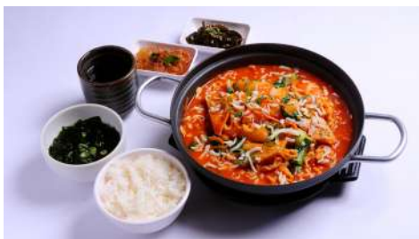
高麗亭 韓式料理 南西店 | B1F / 信義店 | B2F

走進老巴剎新加坡風味美食，將百年傳統盛湯而上，熱衷和堅持，在唇齒間縈繞，記憶中最熟悉的味道，不需再遠渡重洋，盡在老巴剎完整呈現。