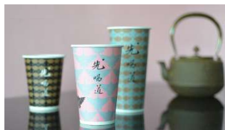
先喝道 信義店 | B2F

精選20餘種上等漢方藥材，經數十小時精心調製而成的「香草麻辣醬」，遵循古法文火熬煮調滷而成。濃郁的麻辣香氣和淡淡的香草味，保證讓您一嚐再嚐。