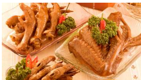
新巴黎香草麻辣滷味 信義店 | B2F