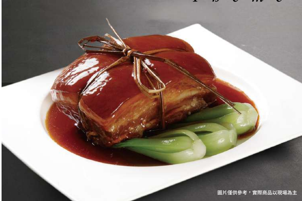
圖片僅供參考，實際商品以現場為主