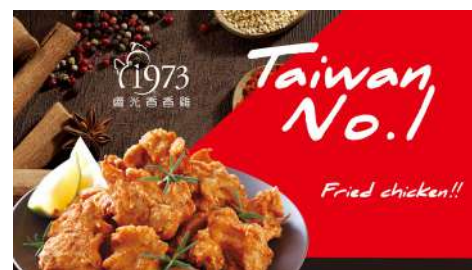
繼光香香雞 南西店 | B1F / 信義店 | B2F

秉持著「用蔬菜來改善人們飲食健康」的精神，我們的理念希望大家可以多吃蔬菜，均衡攝取營養使身體常保健康。