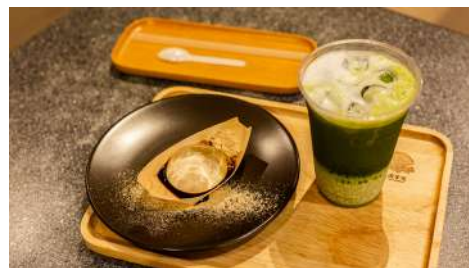
麻茶元 松菸店 | B2F

以滷肉飯為發想，延伸各種台式雙拼，選用台灣最用心的在地食材，想藉由這樣支持台灣各地努力的人們，喚醒國人對台灣的信心與驕傲。