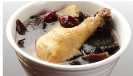
駱姐正雞酒 信義店 | B2F

蚵仔煎是台灣最具有代表性的小吃之一，搭配各式美味小菜，商品豐富多元隨意搭配組合，每天外食最好的選擇。