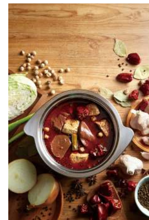
御膳麻辣鍋 湯底費70元

選用北港麻油，搭配蔥蒜爆炒，倒入獨門醬汁，過程中不加一滴水，最後再加入大骨及多種蔬果熬煮的高湯，經典再現。