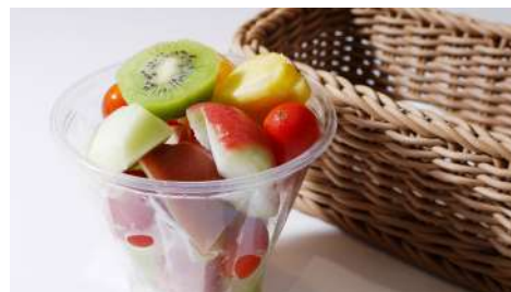
果汁熊 Juice Bear 南西店 | B1F / 信義店 | B2F

高麗亭韓式料理為保有正宗韓式風味，堅持使用韓國原料，讓喜歡韓國料理的消費者們，在台灣也能品嚐到正宗的韓國料理。