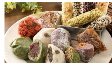
艾芝園米食手工場 信義店 | B2F

HABIBI有別於一般的烘焙坊，是台灣屈指可數的馬卡龍專賣店。HABIBI堅持在台灣手工生產，從外殼到內餡嚴選食材親自製作，提供多樣化的口味選擇。