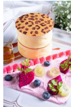
英式豹紋厚鬆餅（綜合水果） 推薦價260元

選用日本進口鑽石粉與保濕度極佳的上白糖煎烤而成的厚鬆餅披覆華麗的豹紋衣裳更顯出時尚的元素。