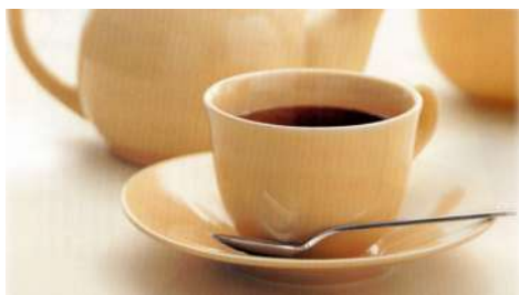
Key Coffee 南西店 | B1F

一直都秉持著品質至上的企業理念，堅持不懈地追求最味道的咖啡，無論時代的潮流如何變遷，我們都力求為各個時代的消費者提供最高品質的咖啡。