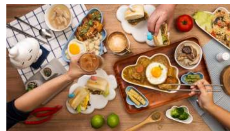
Mr. 雲創意食堂 松菸店 | B2F

水耕生菜+健康米飯=沙拉野餐 有飯的主食沙拉，配上香氣濃郁的自製醬汁，帶著沙拉去野餐，來一場飲食革命吧！