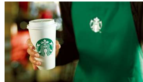
STARBUCKS 信義店 | 1F / 敦南店 | GF

「花都浪漫甜品美妍，猶如一場品味饗宴」在充滿法式情懷的agnès b. café，將帶給您一系列的法式甜品，熱切地邀請您一起來體驗經典的法式生活!!