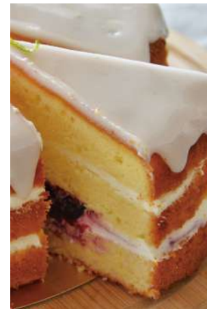
雷夢蛋糕 推薦價160元