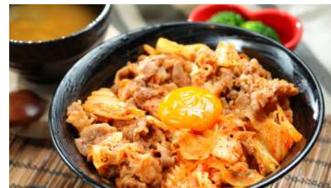
新井 信義店 | B2F

一碗深藏不露的刀削麵，入口煙韌有嚼頭，軟而不黏，越嚼越有麵粉香，而且麵條完全吸收了牛骨湯的精華，好味得令人一口接一口。