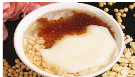
小南門傳統豆花 南西店 | B1F / 信義、松菸店 | B2F

創立於1948年，創立者宮武先生藉由小麥的嚴選、水與鹽比例，鑽研麵粉的知識與技術，製作出勁道、風味絕佳的烏龍麵，是現今自助式烏龍麵的始祖。