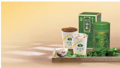
喫茶趣TOGO茶飲 敦南店 | B1F / 信義、松菸店 | B2F

創立於1994年，代理品牌涵蓋法、義、德、西、奧、匈、南非和紐西蘭等地超過三千多款紅、白葡萄酒及香檳。所珍藏之陳年酒款，皆為行家矚目佳釀。