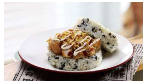
碰咕食米漢堡 松菸店 | B2F

抹茶清新純粹風情、歐夏蕾抹茶文藝時光，輕鬆品味茶道級抹茶魅力，迎接「和式靜涼」！麻茶元為2016日本伊勢志摩G7高峰會選用的茶園出產日本茶。