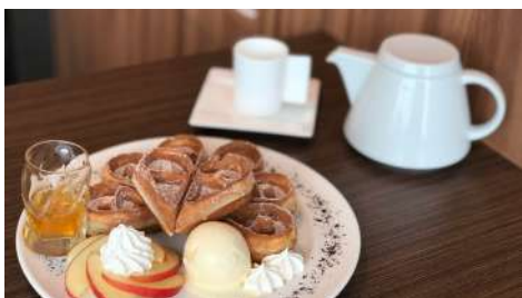
山山來茶 松菸店 | 3F

品牌初衷『親手實做健康美味』，材料堅持大多數採用純天然、有機或選用全球認證及產地直送！讓甜點的口味更加分，也能夠吃的健康又美味。