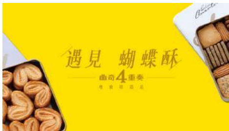
遇見蝴蝶酥 信義店 | B2F

聘請泰籍的廚師將道地泰國料理帶入台灣，採用十幾種天然辛香料，天然正宗泰式風味，讓你沉浸在酸甜辛香的南洋風情！佐以獨家醬料滿足你的味蕾！