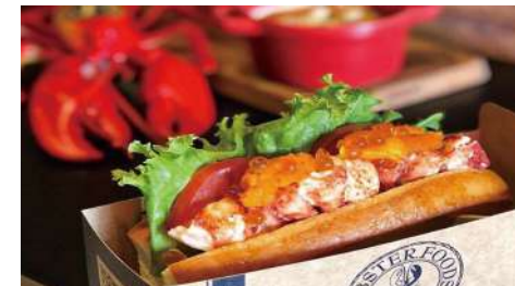
龍波斯特 南西店 | 1F

希望打造一個正宗美味朝鮮食品的品牌，利用韓國獨特醃料，標榜原汁原味跟韓國同步的味蕾，主打不用飛去韓國也吃得到一樣的口味！