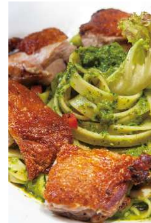
青醬雞腿排寬扁麵

牛肝菌氣味非常強烈而具滲透力，輕輕一嗅便可聞到獨特的香味，用洋蔥、起司、鮮奶油讓牛肝菌和米粒完美結合，香香濃濃口感滑順！