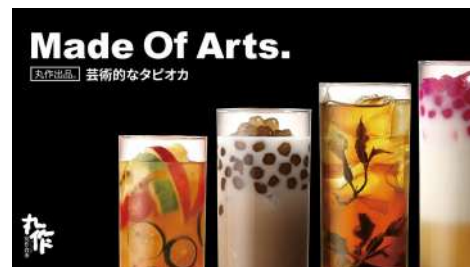
丸作食茶 敦南店 | B1F

誠品敦南店的七見櫻堂食事處，除了挑選幾道較為經典的丼飯為主軸外，也有主廚本身多年私藏的料理，每一道丼飯皆有著研發製作甜點的精神，絕不馬虎！