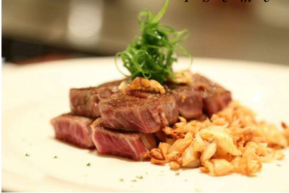
東都 鐵板燒 | 信義店 xinyi store B2F

東都鐵板燒擁有獨立的用餐環境，舒適悠閒享用鐵板料理，飯店級主廚在您面前施展高超的料理手法，在東都鐵板燒，讓您味覺與視覺同時品嘗一場饗宴。