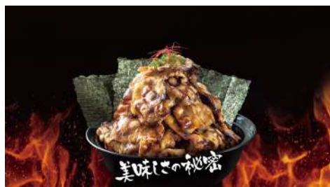
牛角次男坊 南西店 | B1F

結合牛角嚴選肉品及牛角特製秘傳醬汁，以超乎想像的平價，提供高品質的日本燒肉丼。招牌的牛角次男坊并絕對讓饕客霸氣吃飽飽，讚不絕口CP值超高。