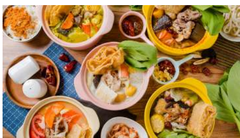
18 獨享鍋 敦南店 | B1F

使用嚴選的杏仁豆並保留營養元素，不添加防腐劑，製作出質潤、氣純、味甘、養生的杏仁食品，口感獨特且風味絕佳，讓人吃過之後就此深深愛上！