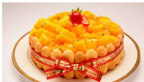
上城糕餅小舖 UPTOWN Pastry Shop 信義店 | B2F

經營20餘載，始終堅持「尊重自然，崇尚原味」初衷，嚴選天然優質食材，專注工藝。提供新鮮的麵包、西點、節慶生日蛋糕、中西式伴手禮。