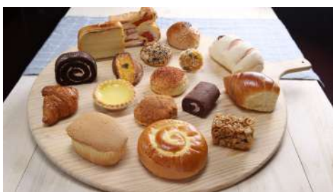
米哥烘焙坊 南西店 | B1F

為日本定食第一品牌，於全台有33家分店，特色在於新鮮與嚴選素材，餐點為當日現場手工調製，進口日本天然發酵醬料，是第一家加入溯源餐廳的日式餐廳。