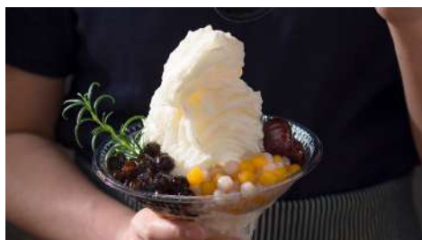
夏樹甜品 南西店 | B1F

一直都秉持著品質至上的企業理念，堅持不懈地追求最味道的咖啡，無論時代的潮流如何變遷，我們都力求為各個時代的消費者提供最高品質的咖啡。