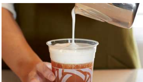
天仁 CHAFFEE 南西店 | B1F

The Greenery源自於澳洲，追求生活飲食的品質，透過新鮮、營養、健康、快速的蔬食/速食，傳遞一個更健康生活的態度。Start Fresh從新鮮開始。