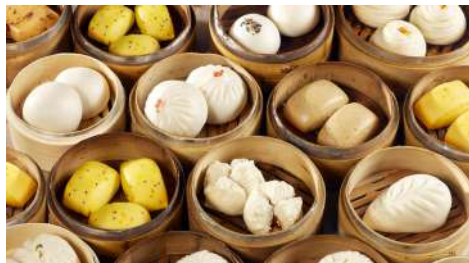
葡吉小廚 南西店 | B1F

被譽為「冰淇淋藝術完美締造者」的Häagen-Dazs自1921年創立後，提供極致臻享的冰淇淋享受為己任，完美寵愛的品牌堅持，風靡全球50多個國家。