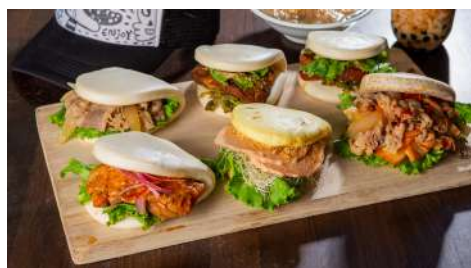
Handbun手拿包刈包 信義店 | B2F

「GOLD MENCHI金葉名氣餅」入油鍋如煙花般綻放地美不勝收的名氣餅，以香脆麵衣包裹多汁的鮮肉內餡之姿，在口中迸出日嚐新食尚美味！