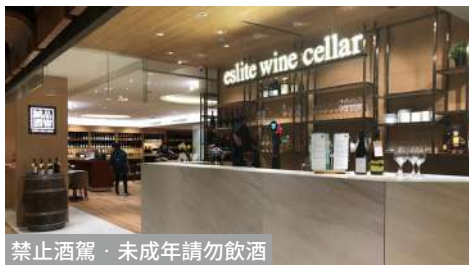
誠品酒窖 敦南店 | B1F / 信義店 | B2F

創立於1994年，代理品牌涵蓋法、義、德、西、奧、匈、南非和紐西蘭等地超過三千多款紅、白葡萄酒及香檳。所珍藏之陳年酒款，皆為行家矚目佳釀。