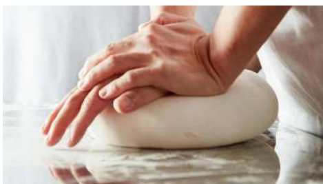
宮武讚岐烏龍麵 南西店 | B1F

結合牛角嚴選肉品及牛角特製秘傳醬汁，以超乎想像的平價，提供高品質的日本燒肉丼。招牌的牛角次男坊并絕對讓饕客霸氣吃飽飽，讚不絕口CP值超高。