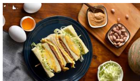
真芳 南西店 | 1F

全球知名甜甜圈品牌最經典的是雋永又美味的原味糖霜甜甜圈。若您尚未嚐過這樣的絕妙滋味，您必須馬上嘗試！還有各種新鮮不同口味甜甜圈供您選擇！