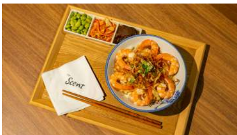
小所在 松菸店 | B2F

創辦人走訪全台客家庄，發揮實驗室不屈不撓的研究精神，將茶葉磨成超微茶粉的喫茶「食茶」方式，為客家人招待貴賓茶點「擂茶」注入與時俱進的嶄新元素。