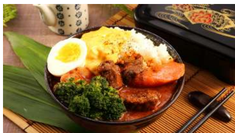
七見櫻堂食事處 敦南店 | B1F

台灣自創外帶港點品牌，首創外帶港點。在東區及信義區貨櫃市集火熱營業，選用優質材料，強調分店時尚乾淨明亮形象，扭轉陳舊飲茶油膩茶餐廳印象。