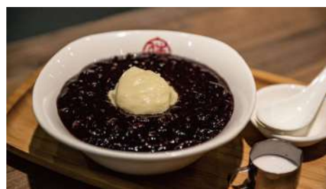
滿哥甜品坊 信義店 | B2F

第一名店創立於2005年。以無毒、養生、醫食同源的概念，引進世界著名廠商產品，以水米油鹽醬醋茶等日常用品，協助顧客吃得安心、健康。