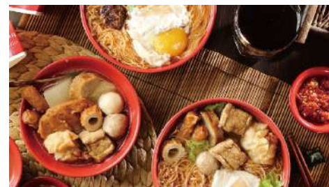
吉甜不辣 南西店 | B1F / 信義店 | B2F

果汁熊所有果汁萃取自天然純淨的蔬果精華，新鮮百分百，美味看的見！安心、健康、享受是我們提供產品給客戶最大的宗旨。