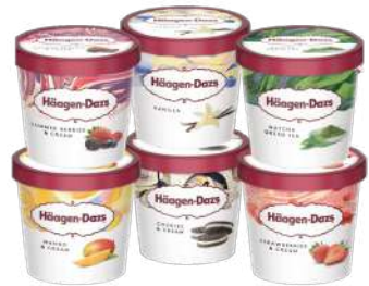
Häagen-Dazs 南西店 | B1F / 信義店 | B2F

來自北歐襲捲全球的精釀啤酒品牌米凱樂以深厚的釀酒功力為底，勇於挑戰框架與人類味覺極限！