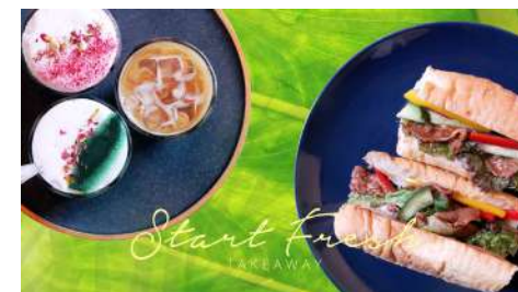
The Greenery 蔬坊 南西店 | B1F

米塔集團30年的茶飲研發經驗，每天職人手炒台灣黑糖，現做珍珠，加上光泉鮮乳，成就「全球最好喝的黑糖珍珠鮮奶！」