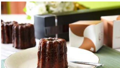
哈肯舖 手感烘焙 Hogan bakery 信義店 | B2F

<THAI.BO!泰飽-泰式飯包>想呈現給大家美味、道地、不添加任何味精的健康泰式飯包。精選多款美味泰式主菜，期待帶給大家不同的味蕾感受。