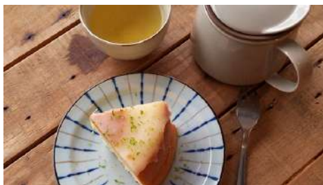
吾穀茶糧 SIIDCHA 松菸店 | 3F

手工老麵饅頭的碳烤香氣、滑溜彈牙的麵疙瘩，「Mr. 雲」以多層次又富變化的創意滋味，讓人嘴裡能品嚐著如雲般夢幻多變又充滿創意的料理！