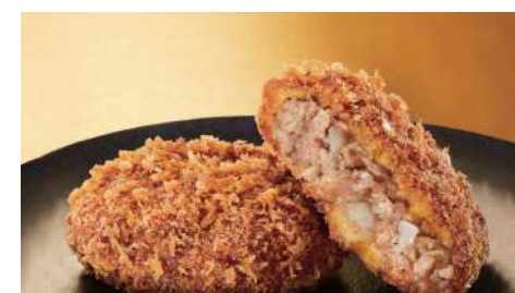
金葉名氣餅 信義店 | B2F

傳承四十餘年父輩手藝傳統港式甜品-秉持[天然食材、石磨手藝、用料實在]專業且用心將最好的養生甜品提供給您。