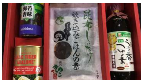
第一名店 信義店 | B2F

溫暖且有鄉村風格的手作甜點店。自然樸實的手作甜點，堅持用台灣的新鮮水果，堅持親自熬煮派的水果香，吃著暖暖的甜點，忽然會想到最初衷的自己。