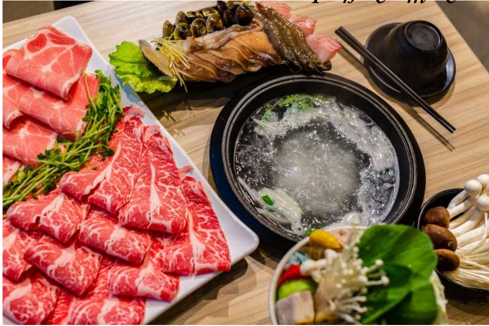
二丁靚鍋 | 松菸店songyan store B2F

怎能少掉鍋物相伴？多種湯底、各式鍋料、170 公克肉盤組成的高 CP 值石頭小火鍋，280 元便能享受冬日的幸福滋味。有別於傳統石頭火鍋，二丁靚鍋先將各種辛香料入鍋拌炒再注入高湯，嘗起來格外清爽。各式鍋物滿足你挑剔的味蕾，大份量肉盤更讓許多肉食主義者趨之若鶩。