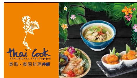
泰酷·泰國料理丼飯 信義店 | B2F

『生活的美好，就該回歸對原味的感動；人的味、麵的味、生活的味。』提供不僅是一碗美味的麵，更是人與食物與生活之間，一種關係聯繫跟一種生活品嚐。