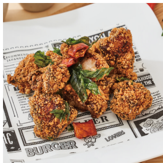
辣椒酥腐乳炸雞塊