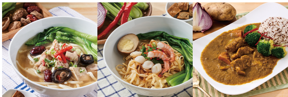
黃金咖哩藜麥米飯