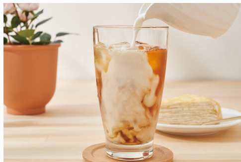
日月潭紅茶雪鹽奶蓋