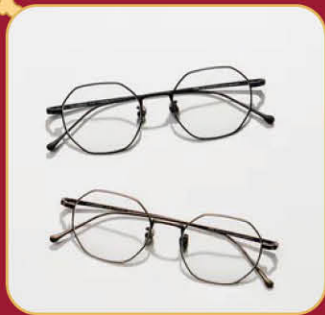
★ Classico | 2F CLASSICO - T59 推薦價 5,680