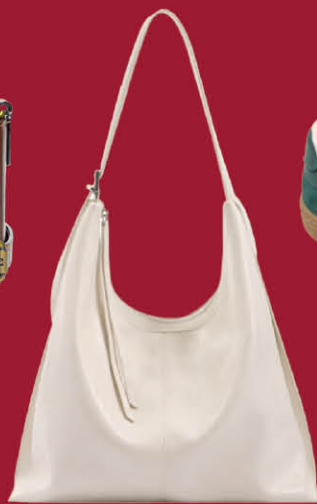
★ Blank space | 2F 8.01-8.14 Wind 兩用拉鍊托特包全色 特價 3,480 | 原價3,780