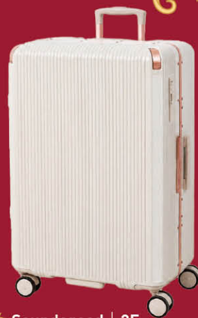
★ Soundsgood | 2F USSARO 復古休閒行李箱 26吋 7,990 28吋 8,950