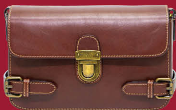
★ 寇比手工皮件 | 2F 英倫真皮復古斜背包 特價 2,500 | 原價3,480