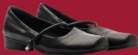
★ Blank space | 2F 7.10-7.31 Una 瑪莉珍低跟芭蕾舞鞋 特價 2,180 | 原價2,380