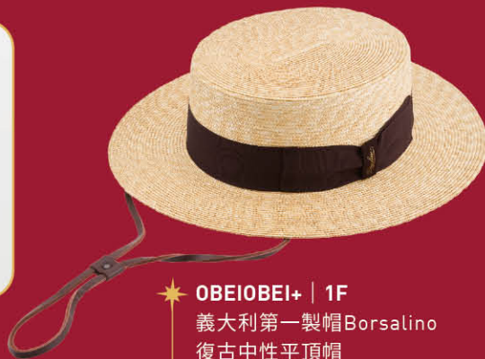
★ OBEIOBEI+ | 1F 義大利第一製帽Borsalino 復古中性平頂帽 特價 14,100 | 原價14,900