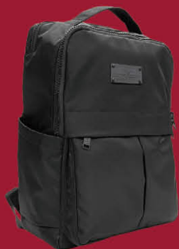
★ deya | 2F Essence極簡回收機能背包 推薦價 2,980