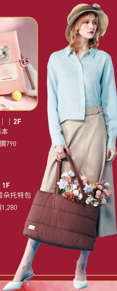
★ ST.MALO W. | 1F 澎彈Airy慕斯雲朵托特包 兩件 8折 | 原價1,280