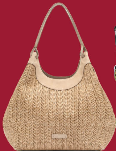
★ GIANNI CHIARINI | 1F DUA大型草編托特包 特價 13,160 | 原價18,800