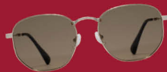
★ KlassiC. | 2F 輕行者摺疊墨鏡FM004 兩件 85折 | 原價1,980