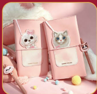
★ Nimmy friend | | 2F 新大眼萌寵手帳本 特價 632 | 原價790