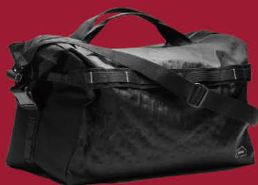
★ bitplay | 2F 38L 跨境行李袋 特價 3,000 | 原價3,480